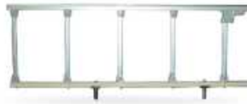
PSR-001 (FOLDING SIDE RAIL)