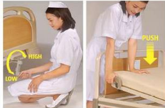
Crank operation system

A unique eye catching foldable crank is designed to give high-low bed adjustment.