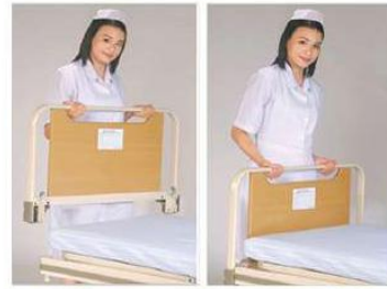
Head/foot board panel dismantle