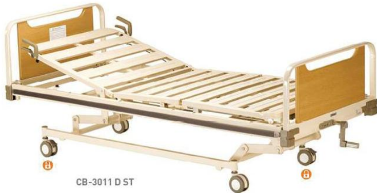
CB-3011 D ST