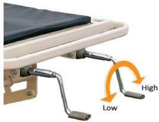
Crank Operational System