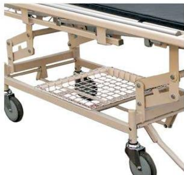
Multi purpose Tray