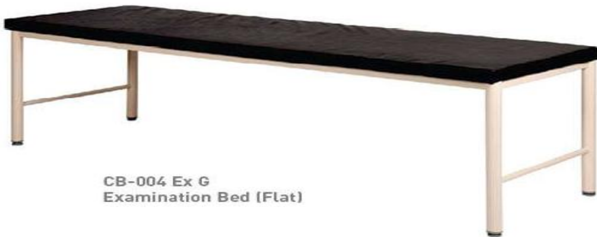
CB-004 Ex G Examination Bed (Flat)