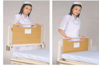
Head/foot board panel dismantle