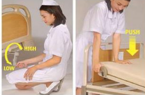
Crank operation system Back raise adjustment

A unique eye catching foldable crank is designed to give high-low bed adjustment.