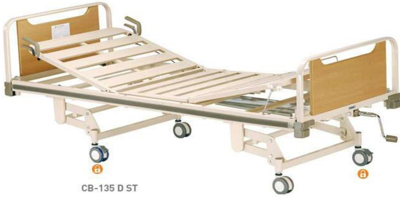
CB-135 D ST