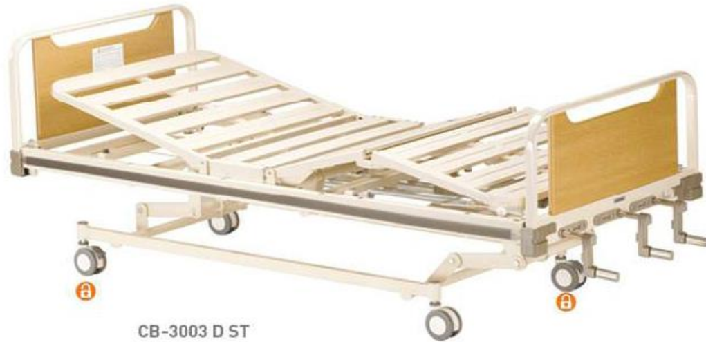
CB-3003 D ST