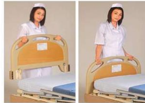
Head/foot board panel dismantle