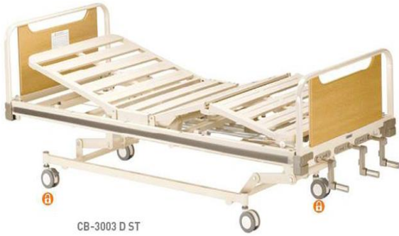
CB-3003 D ST