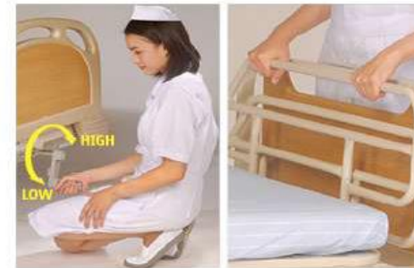
Crank operation system

A unique eye catching foldable crank is designed to give high-low bed adjustment.