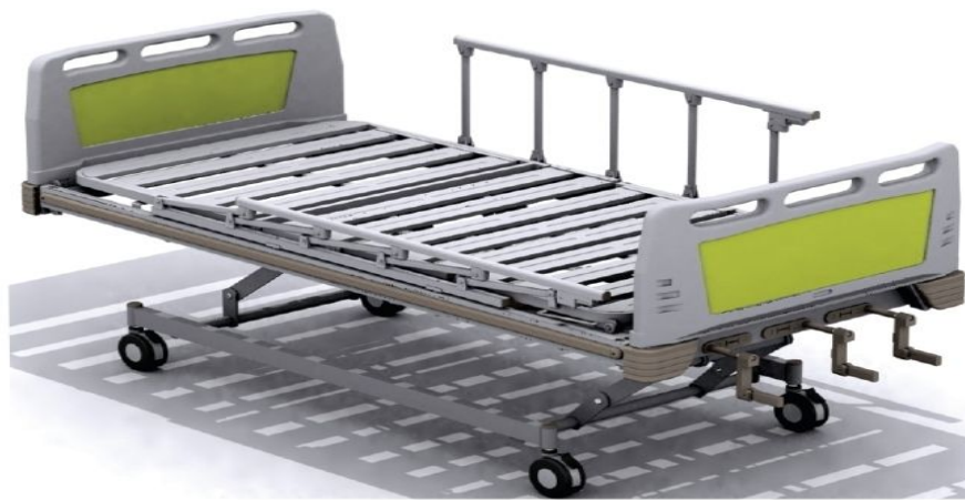
Type Optimus - 3M