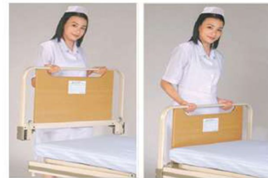
Head/foot board panel dismantle