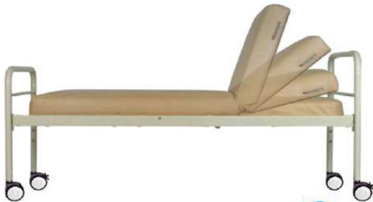
CB-002 with caster