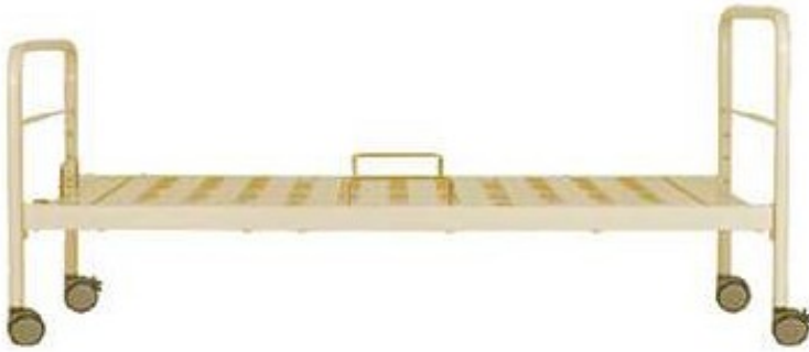
CB-001 D with caster