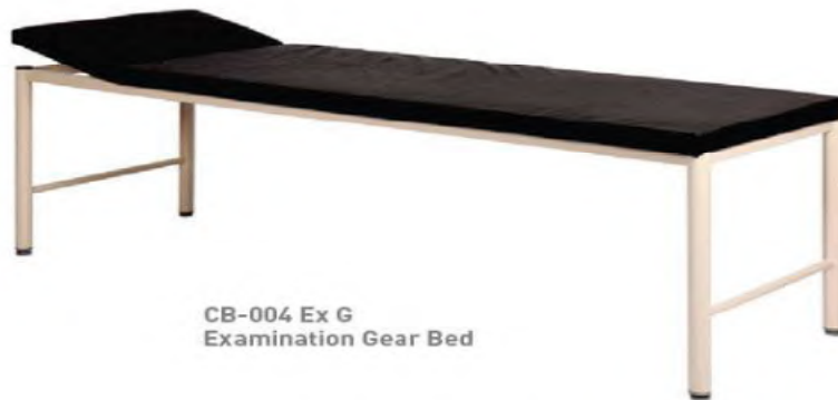
CB-004 Ex G Examination Gear Bed