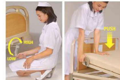
Crank operation system Back raise adjustment

A unique eye catching foldable crank is designed to give high-low bed adjustment.