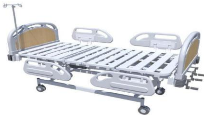
Fitur Head/Foot Board