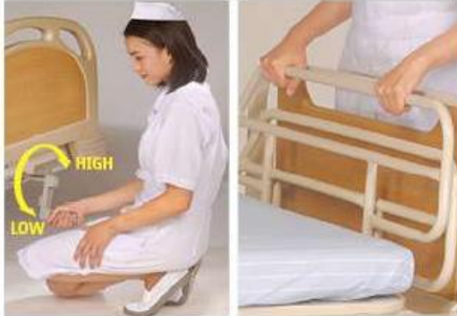
Crank operation system

A unique eye catching foldable crank is designed to give high-low bed adjustment.