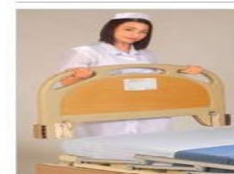
Head/foot board panel dismantle