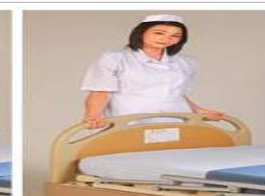
Head/foot board panel installation