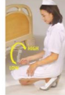
An unique eye catching foldable crank is designed to give high-low bed adjustable