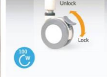
Independent lock caster (one at front and one at back of the bed) provides stability and secure parking