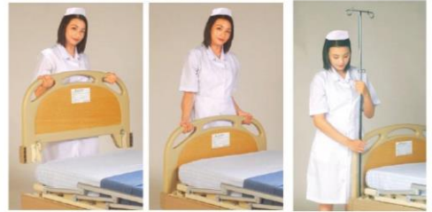
Head/foot board panel dismantle