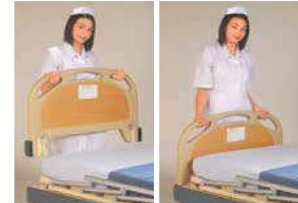
Head/foot board panel dismanile