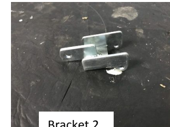
Tabel 3 Metoda dan Urutan Proses Penggantian Cable